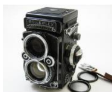
二 眼 レ フ 写 真 機

写真を撮るには今まで全く興味が無かった事にも関心が高まる。被写体に関する多くの事を知っていた方が良い写真に繋がることにも気がついた。「風景写真」の場合は、被写体に当たる日の光の位置や角度、また、その地の歴史などを知っておくと撮り方まで変わってくる。