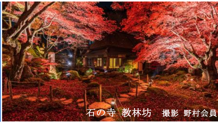
石の寺 教林坊

発行者 香川 修司 連絡先 事務局 島津 晃 0467730515 三井所 信夫・小倉 進 編集者 島津 晃・白尾 幸子