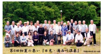
参加者は34名でした