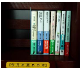
コピー機の隣り「今月のお薦め」コーナーを設けました

今月より推薦図書の展示場所をクラブハウス会議室より、玄関入って左すぐの本棚に変更させて頂きました。なお推薦図書以外の図書は今迄通り、会議室の本棚で変わりありません。