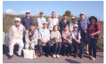
14名が参加しました