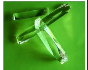
実験で出来た水晶

私が東通に入って最初の職場が石作り(水晶)のところで、その後30年間石作りをしてきました。「石の上にも30年」、最初は通信機に使えるようなものは出来ず、いわゆる3K職場?で毎日大汗をかいて研究を進めていました。その後ある指導者が入社され、電気試験所、東大生研、無機材研、等で研鑽をつみ、やっと透明な水晶ができました。