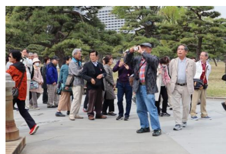
皇居にて2台のバスが合流