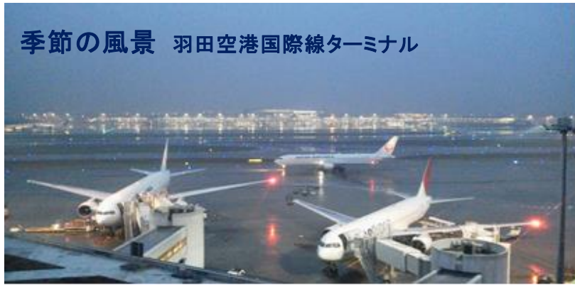
季節の風景 羽田空港国際線ターミナル

発行者 香川 修司 連絡先 事務局 加藤 光義 0467-73-0515 小倉進・三井所信夫 編集者 島津 晃