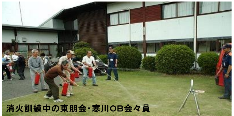
消火訓練中の東朋会・寒川OB会々員

第2回「AED講習・消火・避難訓練」 5月20日(火) 湘南クラブハウス 28名参加