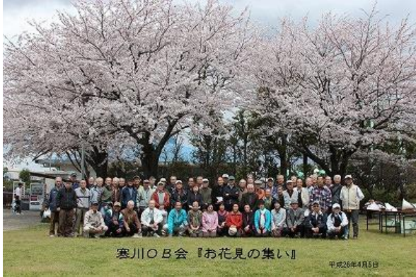
寒川OB会『お花見の集い』

平成26年4月5日(土)寒川町水道記念館 好天にも恵まれ、総勢61名が集いました。