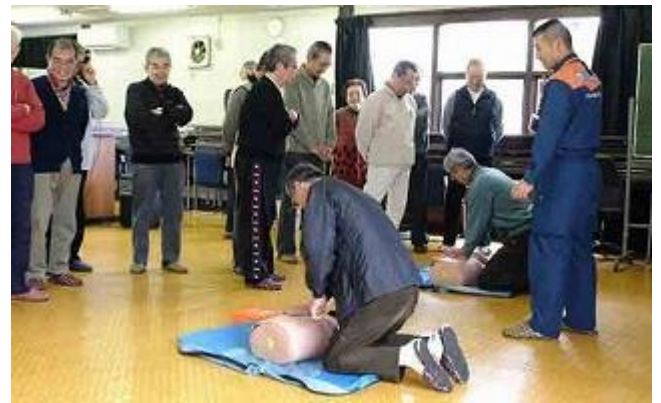
上手に出来ました!