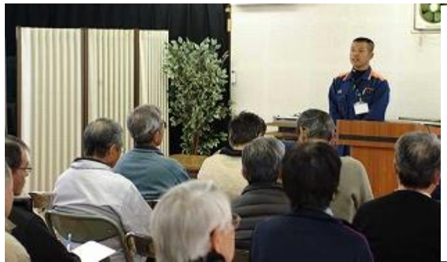
お話しをよく聞いて

心肺停止状態時の心臓マッサージとAED(心臓除細動器)の操作方法を聴き、全員が実際に体験してみました。